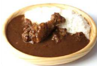
ひろの赤鶏カレー